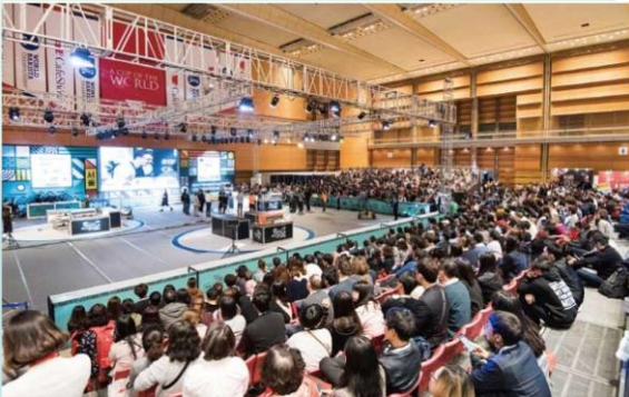
2017 월드 바리스타 챔피언십 한국 최초 개최 - 카페쇼

KCC 대회는 WCC에서 인증한 한국 유일의 월드 커피 챔피언십 대표를 선발하는 대회입니다.